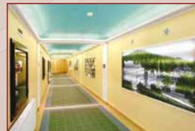
Corridor Via Imperialis